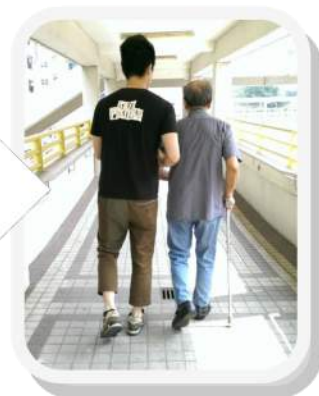
參加者帶陪同長者到附近商場購物