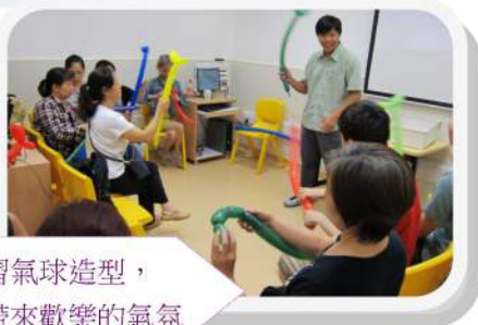
參加者學習氣球造型，為探訪時帶來歡樂的氣氛