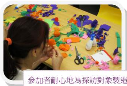
參加者耐心地為探訪對象製造驚喜禮物