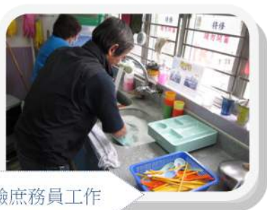
參加者到長者中心體驗庶務員工作