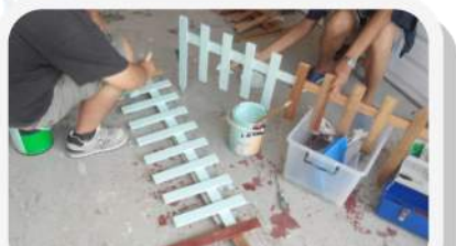
參加者齊心合力為營地建造美麗的護欄